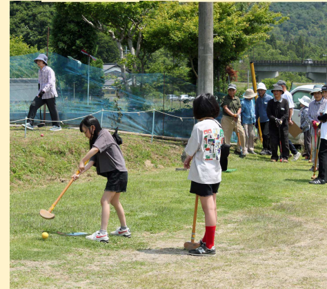
猪崎グランドゴルフ大会