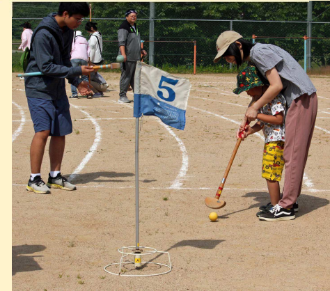
城山グランドゴルフ大会

5月26日(日)城山自治会は庵我小学校校庭、猪崎自治会はクラブの競技施設で、それぞれグランドゴルフ大会が開催されました。 天候にも恵まれ、お年寄りから子供まで幅広い年齢でチームを編成してスタート。初めての子供は、ベテランの方から手ほどきを受けるとすぐに上達、いっぱしのグランドゴルフプレーヤーに... 城山・猪崎とも地域のコミュニケーションが図れた一日となりました。